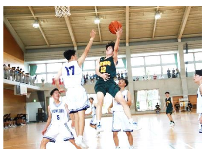
華麗なるシュート!!!