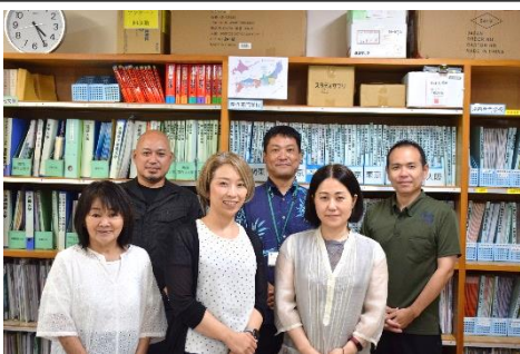
中農進路指導部のみなさん

Teams を使って生徒に進路情報を提供していますが、保護者にはHPやスクリーン等でも提供できるように検討しています。また、生徒は知っていても保護者は知らないなどといった事例は少なくなってきていますが、是非、親子のコミュニケーションを密に取ってほしいと思います。進路実現のためには親の協力が必須なのできちんとお話をさせていただきたいです。