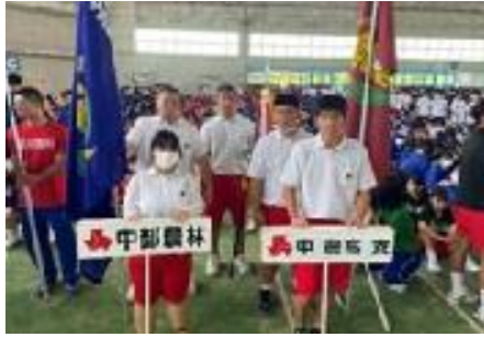
3年ぶりの総合開会式 凛々しい姿。頼もしいです!!