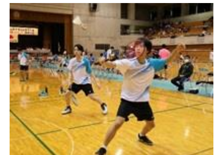
相手チームのスキを突く