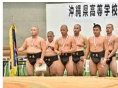
相撲部、団体7連覇!個人各階級完全制覇! 九州・全国大会出場おめでとう