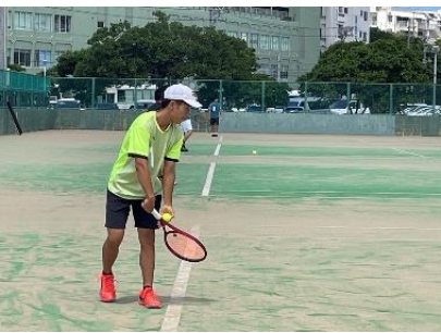
サービスエースだ