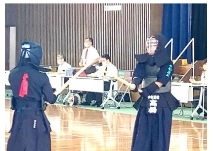
静なる闘志を見よ!