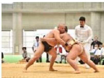
気迫あふれる立ち会い