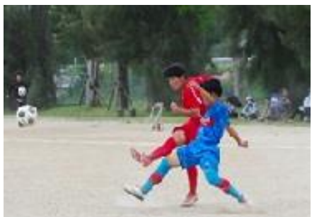
サイドから切り込んでシュート