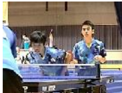
自慢のコンビネーション