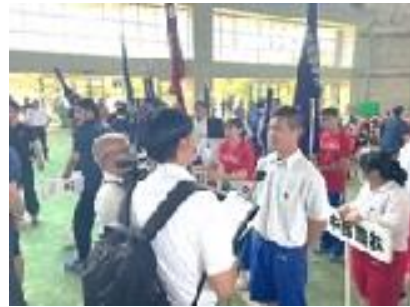
インタビューに照れ笑い!?