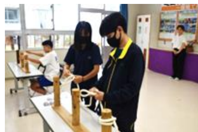
造園科での体験の様子①