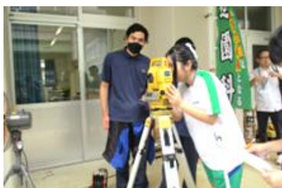
造園科での体験の様子③