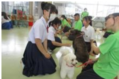
熱帯資源科での体験の様子①

体験入学は2つの学科を選択し、それぞれの学科で実習を教わります。中農生は丁寧に教え、会話も弾むのであっという間に時間が過ぎていきました。アンケートからは「もっと体験時間を延ばしてほしい」「素敵な体験ありがとうございました」「勉強のモチベーションが上がった」など嬉しい言葉がたくさんありました。参加してくれた中学生の皆さん、また対応してくれた中農生の皆さん、本当にありがとうございました♪