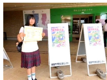
意見発表Ⅰ類 優秀賞