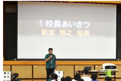
全体会での校長先生のお話の様子