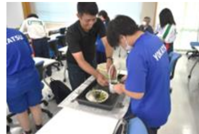
定時制農業科での体験の様子②