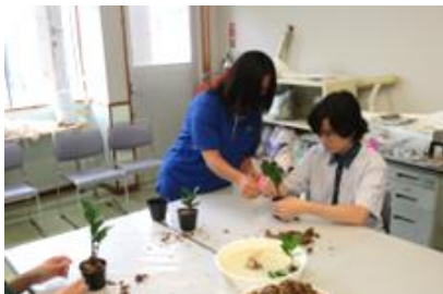
園芸科学科での体験の様子①