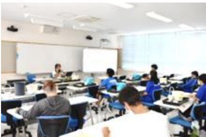
定時制農業科での体験の様子①