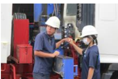
造園科での体験の様子②