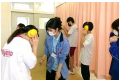
福祉科での体験の様子①