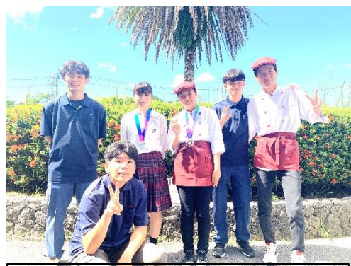
大会に出場したメンバー