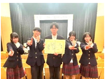
プロジェクト発表 最優秀賞受賞