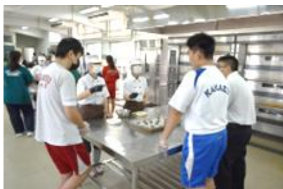
食品科学科での体験の様子①