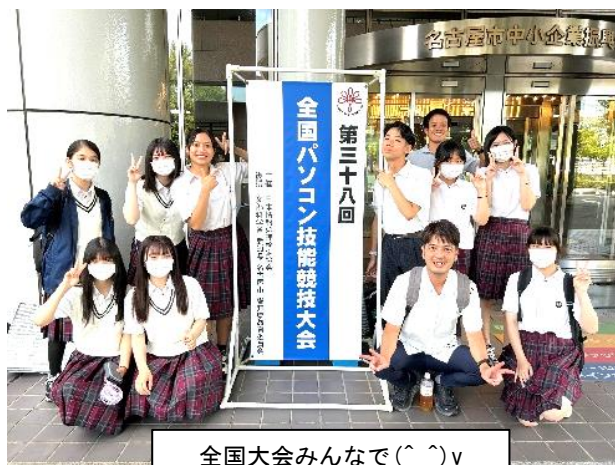
全国大会みんなで(^_^)v

団体で一番得点が高い選手として2年生が、佳良賞を受賞しました。皆さん本当に頑張りましたね。お疲れでした!!