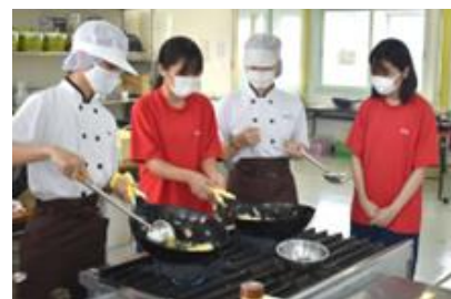
食品科学科での体験の様子②