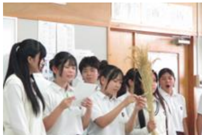
熱帯資源科での体験の様子②