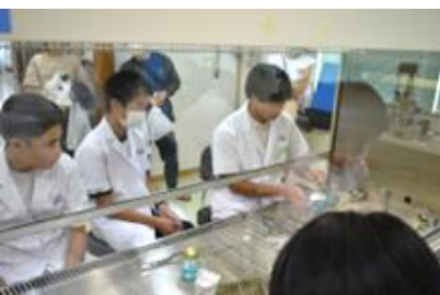
園芸科学科での体験の様子②