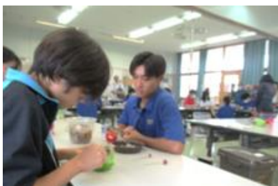
園芸科学科での体験の様子③