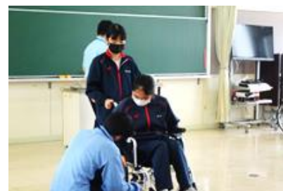
福祉科での体験の様子②