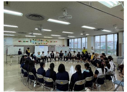
ポリビア校から生徒6名が来校 歓迎式や各学科で交流体験 園芸：バイオ体験、福祉：ゲーム交流会 他