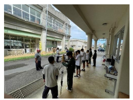
体験入学 各学科では生徒が講師になり開催 食科：チャーハン調理 熱資：犬とのふれあい 造園：測量機器 他