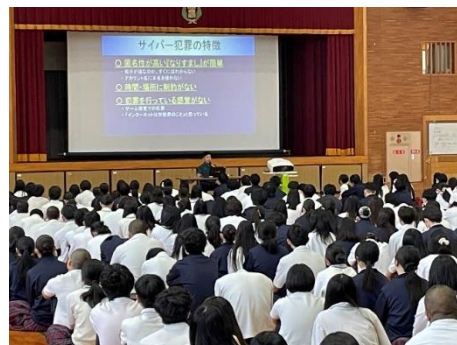
情報モラル 県警担当者を講師に開催