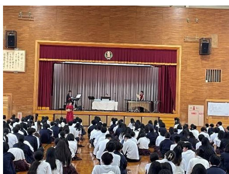
芸術の秋 アンサンブルユニット「ちえるきお」による音楽鑑賞会