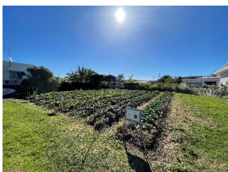
ブロッコリー、レタスの栽培