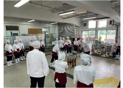
食品科学科 新春餅つき 行事