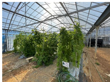
ハウス ゴーヤ栽培 (ミバエ対策)