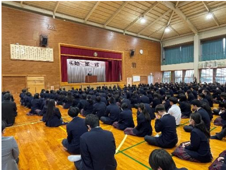
元気に登校し、3学期始業式

保護者の皆様のご参加をお持ちしております。今回は、農業祭後の農場等の様子を紹介します。