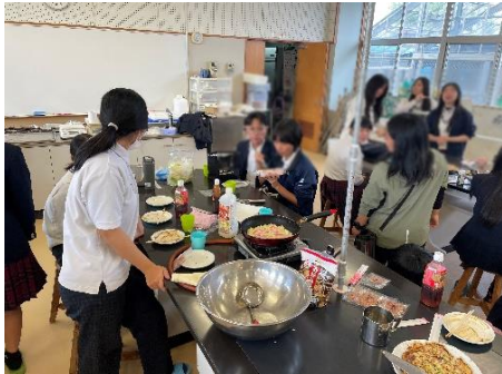
熱資 新春お好み焼き会 自作キャベツ使用