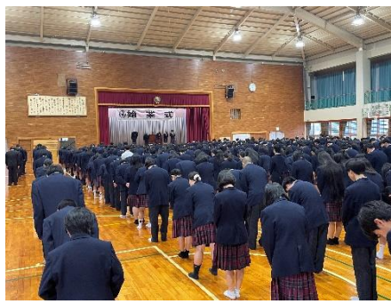
中農マナトレ 皆きちんと取り組みます