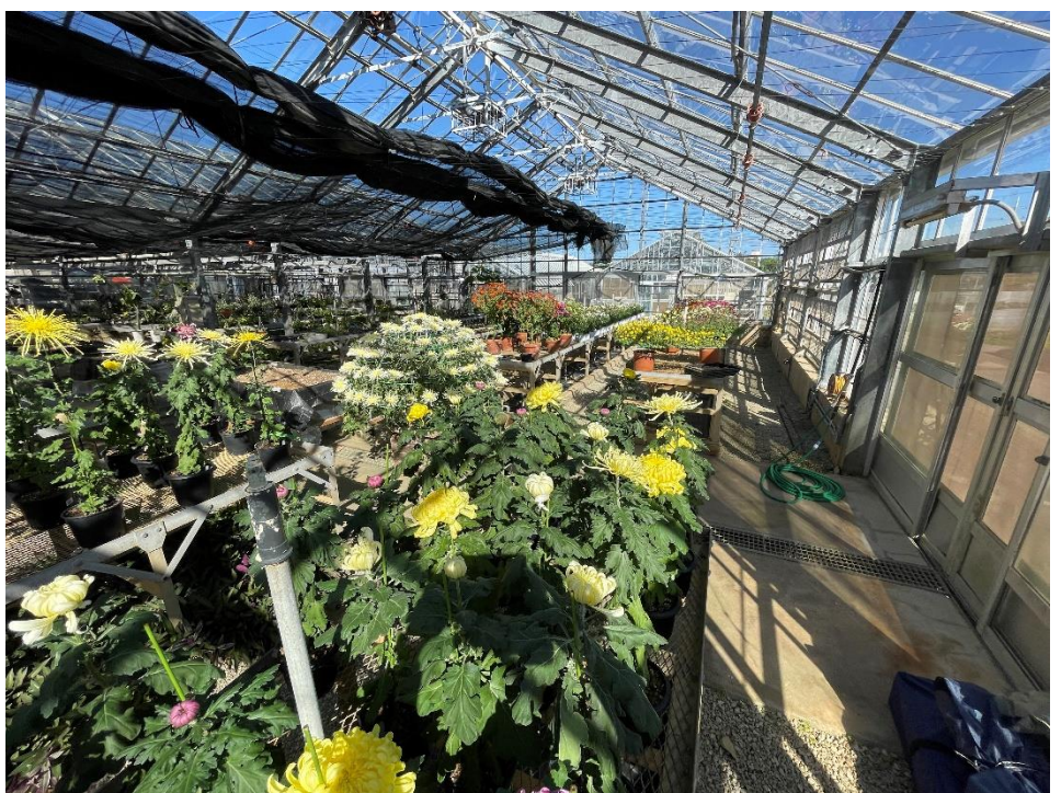
開花調節技術により創立記念式典を彩ります 大ギク、千輪仕立て 鉢物キク